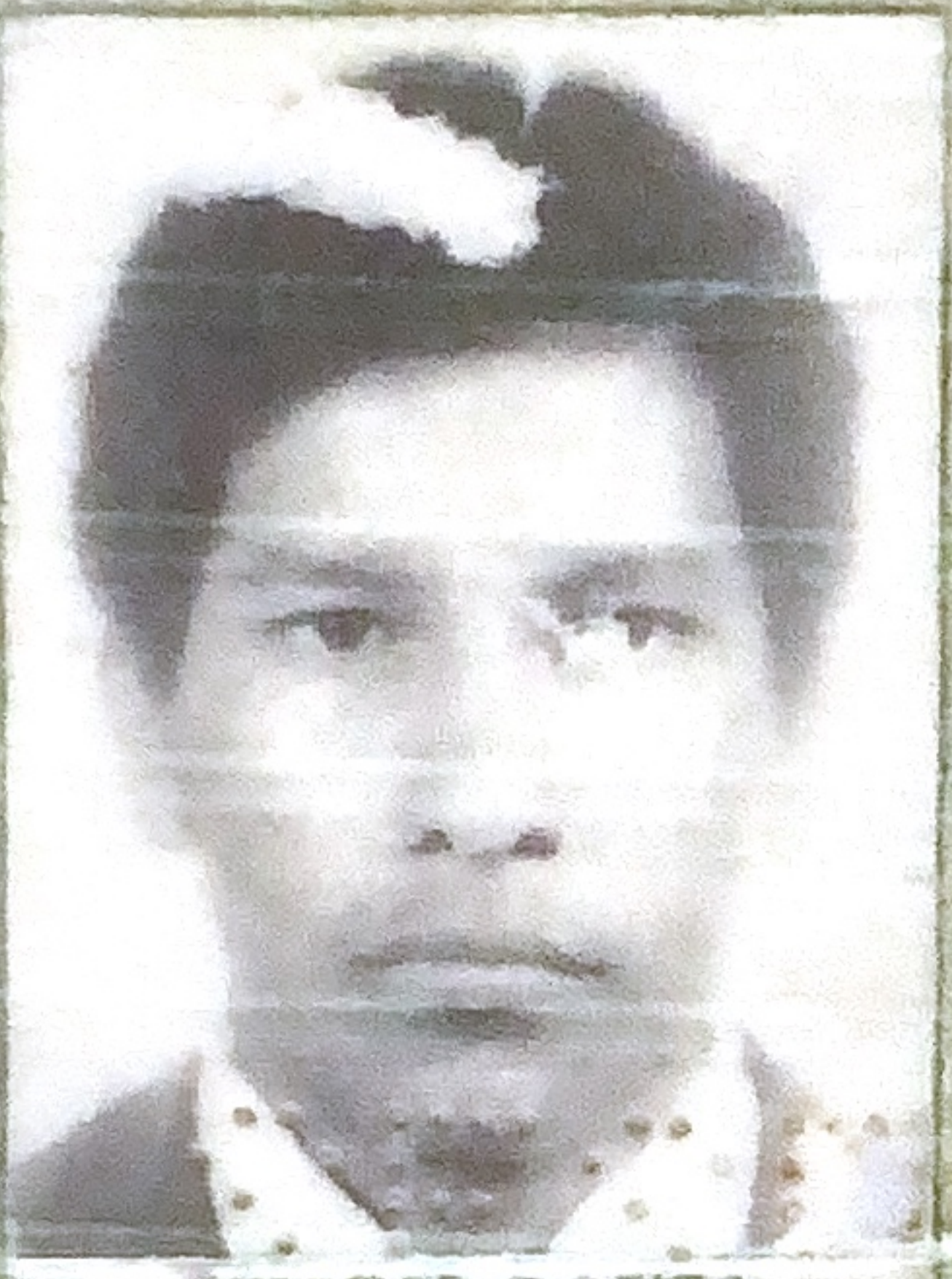
ULEGAR O REITO